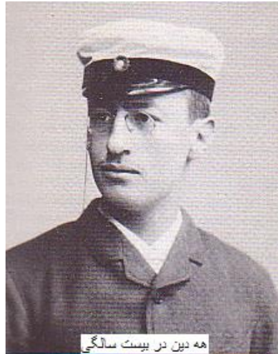
هه دین در بیست سالگی

او تحصیلات عالی خود را در دانشگاه استکهلم آغاز نمود و در سال ۱۸۸۸ میلادی لیسانس خود را در رشته زمین‌شناسی، جانورشناسی و زبان لاتین در دانشگاه اوپسالا ۴ به پایان رساند.